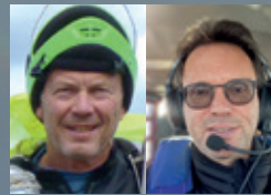
Euer Paranodon Team